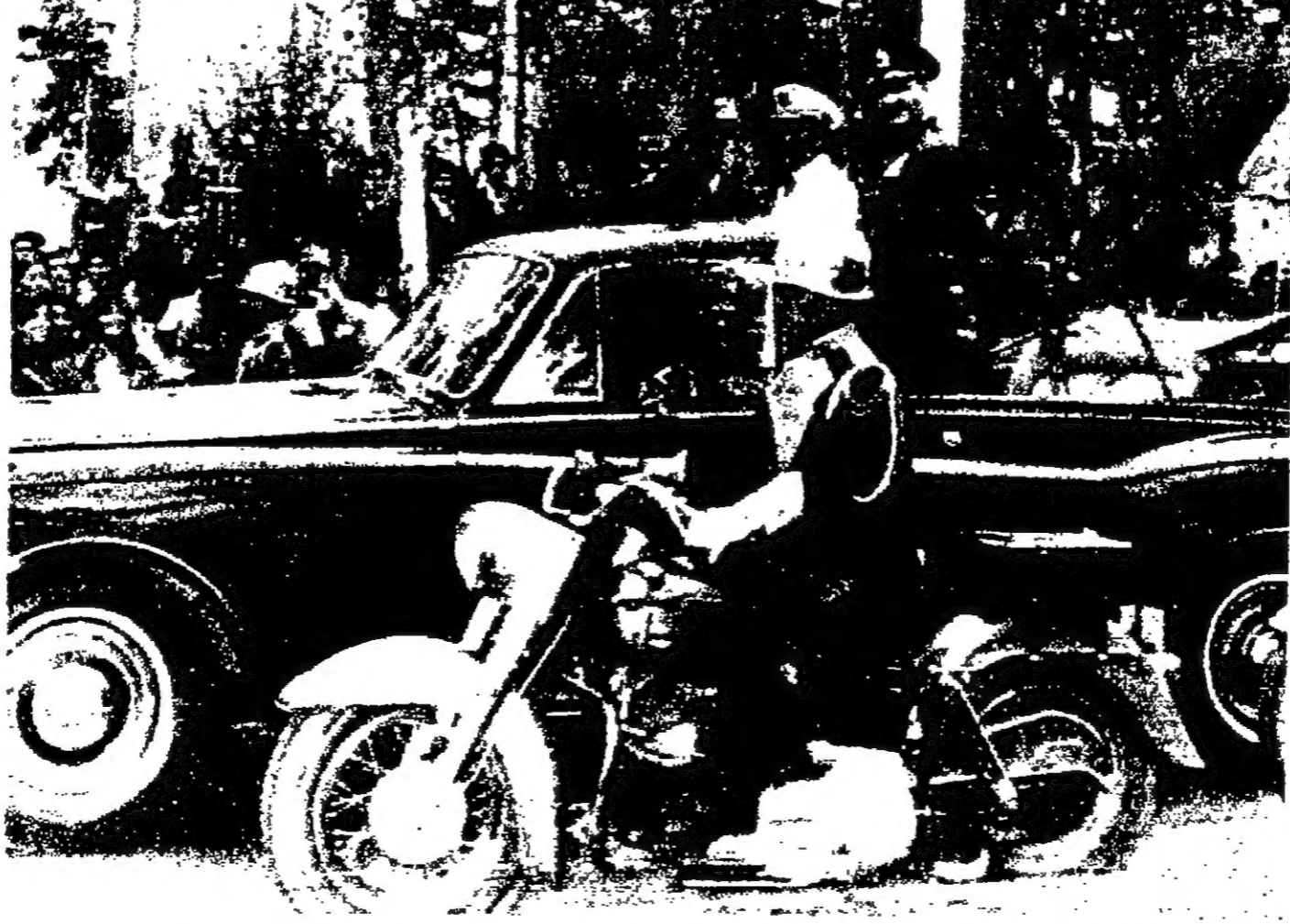
جلالة الملك الحسين الثاني وجلالته ساه إيلون بنشاز طرقيها من المارادي وصول المائل الحرس إيلون بنشاز صورة تلوين تلوين

الكيمي للرياض البيوه ليكون في استقبال الحسين الكويت - ١٠ - ١٩٦٥ - ١٧ نيسان سنة ١٩٦٨ م رقم العدد ٦٦٦